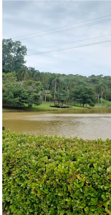
Park Aquático Thermas Águas de São Pedro :